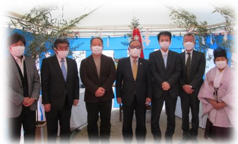
上：安全祈願の祝詞、さんコープ岡崎理事長他による地鎮の儀等、厳かに滞りなく執り行われた地鎮祭。これから秋に向け、さんコープ・設計業者・建築業者が協力して新しい拠点を作り上げていきます。 下左：建物外観の完成予定図。木造平屋の趣ある建物で、利用者さんのくつろぎの空間と時間を提供します。