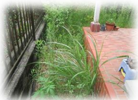
☆草取り作業 作業前・作業後