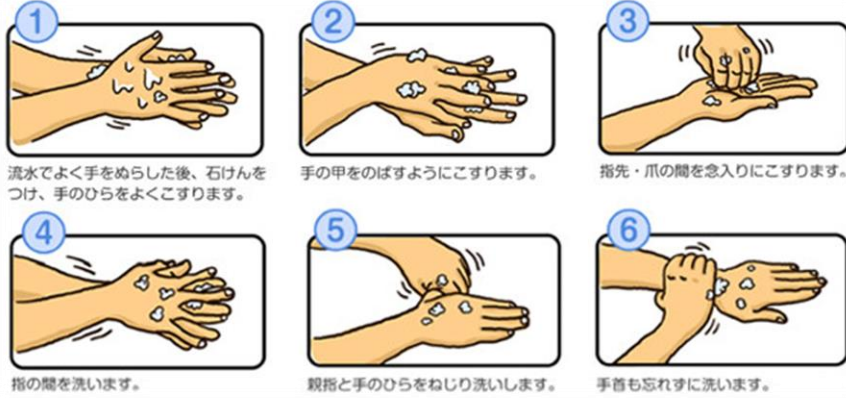
流水でよく手をぬらした後、石けんをつけ、手のひらをよくこすります。