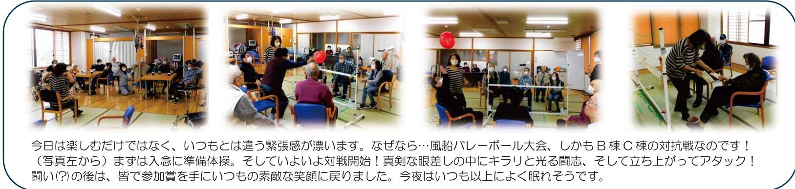
今日は楽しむだけではなく、いつもとは違う緊張感が漂います。なぜなら…風船バレーボール大会、しかもB棟C棟の対抗戦なのです！（写真左から）まずは入念に準備体操。そしていよいよ対戦開始！真剣な眼差しの中にキラリと光る闘志、そして立ち上がってアタック！闘い(?)の後は、皆で参加賞を手いつもの素敵な笑顔に戻りました。今夜はいつも以上によく眠れそうです。

周囲を緑に囲まれ、四季折々の暮らしを満喫できます。施設のすぐ側には常盤公園や常盤湖周遊路もあって、自然環境にも恵まれています。是非一度、気軽に見学にお越し下さい。お待ちしております！