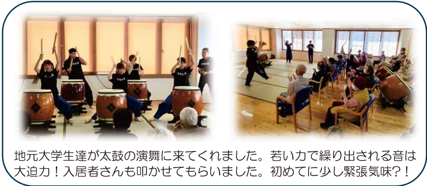
地元大学生達が太鼓の演奏に来てくれました。若い力で繰り出される音は大迫力！入居者さんも叩かせてもらいました。初めてに少し緊張気味？！

さんコープ宇部有料老人ホームは、身の回りのことが自分で出来る元気な方はもちろん、介護が必要な方々も第二の我が家として「ふだんの暮らしそのままに」生活をしていくための住宅です。介護が必要になった場合でも、地域のケアマネジャーや併設するさんコープ居宅介護支援事業所のケアマネジャーと介護サービス事業所が一緒になって、有料老人ホームでの元気な暮らしを支援いたします。今回は、そんな「元気な暮らし」の一部をご紹介します。