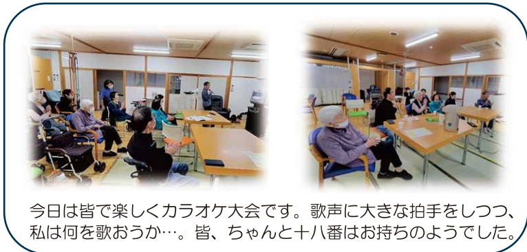
今日は皆で楽しくカラオケ大会です。歌声に大きな拍手をしつつ、私は何を歌おうか…。皆、ちゃんと十八番はお持ちのようでした。